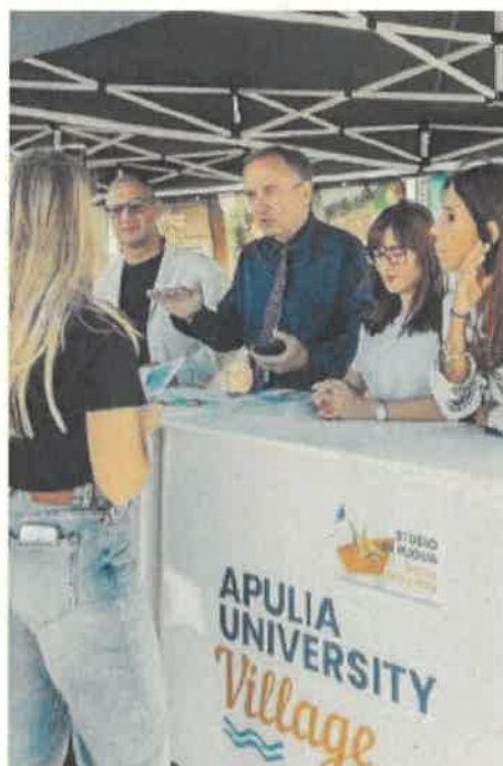
LA FIERA DELLA FORMAZIONE Dal 16 al 18 ottobre, negli spazi della Nuova Fiera del Levante di Bari

Organizzata da Firenze Fiera, Didacta Puglia è uno spin-off dell'edizione nazionale con partner istituzionali di rilievo. Nei talk si parlerà della filiera formativa tecnico-professionale con i nuovi percorsi 4+2 degli ITS Academy.