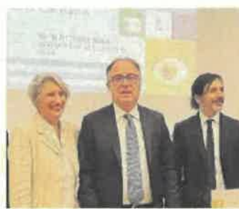
I TEMI TRATTATI Dalle tecnologie digitali, alle nuove metodologie didattiche